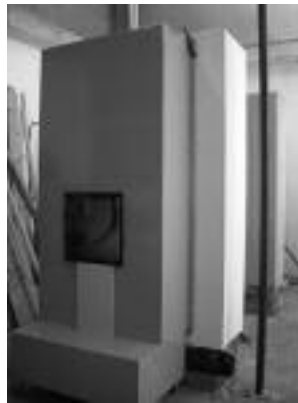
Fotografía nº4: Equipamiento de ensayo para el procedimiento UNE-EN 12865:2002