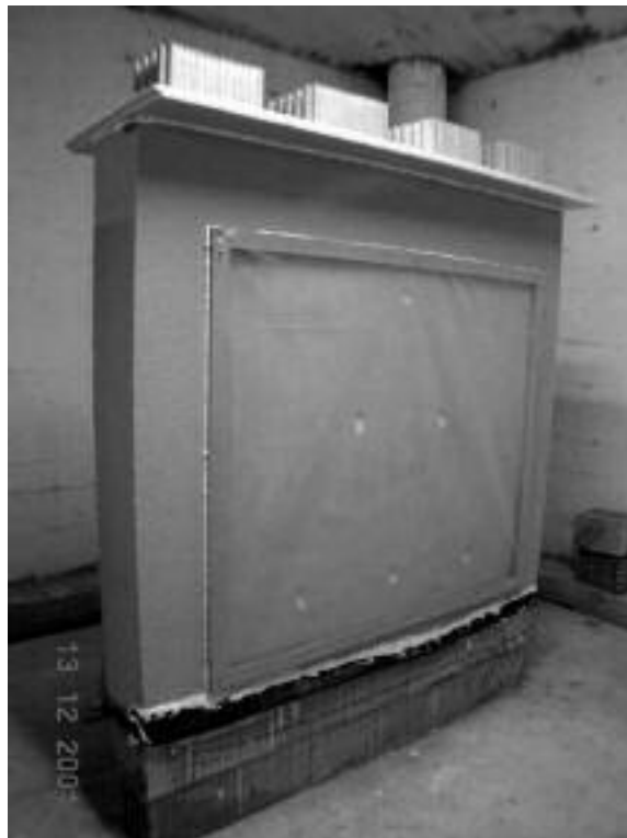
Fotografía n°2: Impermeabilización de la zona de ensayo en el procedimiento CIDEMCO CO-115