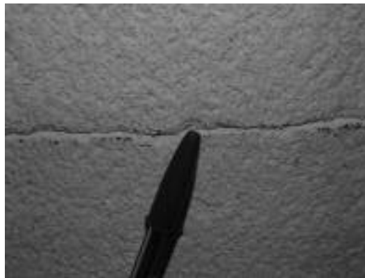
Fotografía nº5: Fisura simulada en mortero monocapa