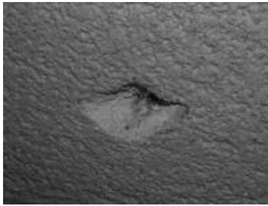
Fotografía nº3: Perforación en el revestimiento exterior para verificar el grado de penetración de agua una vez realizados los ensayos.